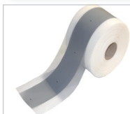
Cosmo Standard-Dichtband Art.-Nr.: 101263 Dichtfläche auf Lochgewirke