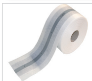
Cosmo System-Dichtband Mittelstreifen Art.-Nr.: 101264 beidseitig vlieskaschirtes Dichtband