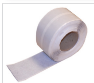
Cosmo Butyl-Dichtband Art.-Nr.: 101170 selbstklebend, Vliesoberseite, auf Silikonpapier