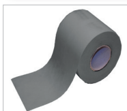
Cosmo Vlies-Kautschuk-Dichtband grau Art.-Nr.: 101188 vlieskaschirtes Dichtband mit Dichtmembrane Kautschuk