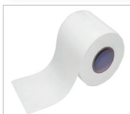
Cosmo Vlies-Vlies-Dichtband weiß Art.-Nr.: 101203 reines Vlies-Dichtband