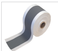
Cosmo Objekt-Dichtband Art.-Nr.: 101173 Dichtfläche auf querelastischem Vlies

Weitere zur Auswahl stehende Dichtbänder, auch jeweils mit den entsprechenden Formteilen. Fragen Sie diese gern bei uns an.